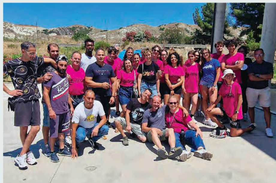
Luglio 2025, una delegazione dello Spi di Sondrio ha partecipato al campo organizzato a Isola Capo Rizzuto insieme a un gruppo di giovani dell'associazione Bimbo chiama bimbo di Brescia

Cosa possiamo fare dunque noi pensionati? Intanto, invitare tutti i giovani che conosciamo, partendo dai nipoti, a partecipare a uno dei campi iscrivendosi direttamente sul sito di Libera ( https://www.libera.it/it-schede-22-estateliberi ). E poi partecipare come volontari seguendo il calendario che lo Spi Cgil nazionale renderà disponibile a breve. I pensionati interessati possono scrivere a questa email: legalitapolitichegiovanili@spi.cgil.it