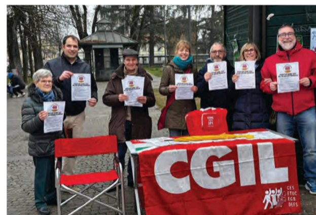
Nelle foto alcuni banchetti organizzati dalle leghe Spi Cgil Ticino Olona